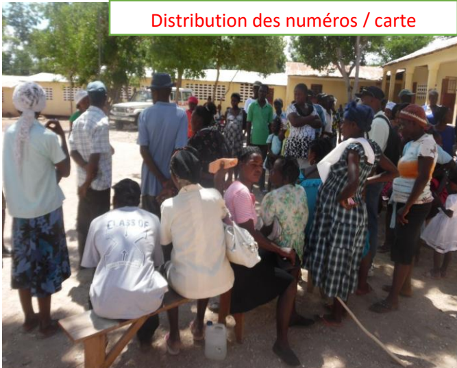
Distribution des numéros / carte